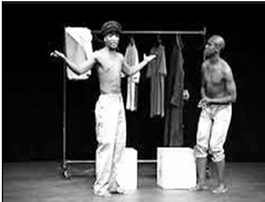
'n Toneel uit 'n produksie van Woza Albert!

Bestudeer BRON A hieronder en beantwoord die vrae wat volg.