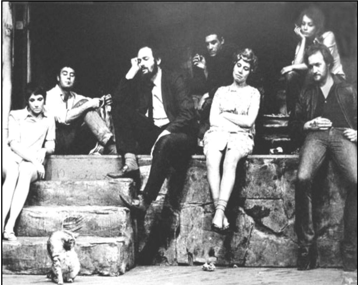
Die oorspronklike geselskap van Siener in die Suburbs – 1971